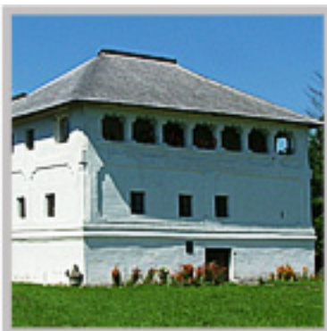
Complexul Muzeal Măldărești