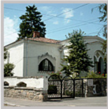
Muzeul de Artă Medievală Și Modernă

Un spațiu ce pune în valoare expresivitatea Simian, construită în 1940, de arhitecții Gheorghe Simotta