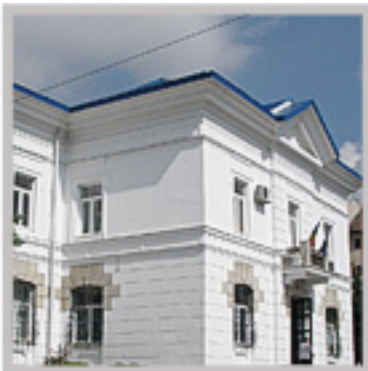
Muzeul Județean de Istorie Vâlcea

Alături de milenara creație populară, numeroase monumente istorice și de artă din cuprinsul Vâlciei, ates